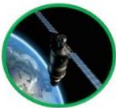
Aérospatial - Défense